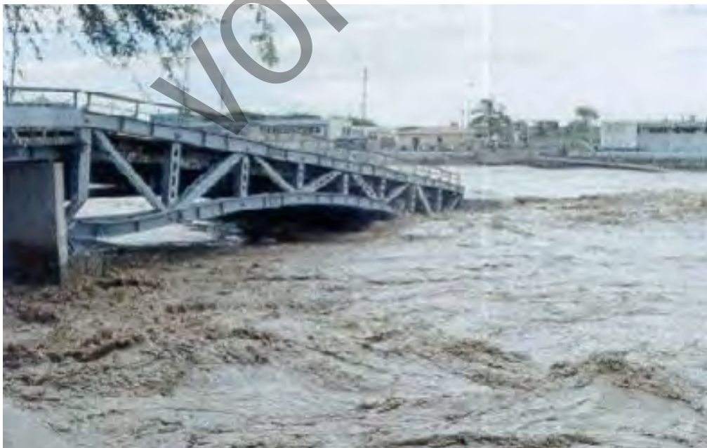
Bild 1: Zerstörung einer Brücke durch Auskolkungen

Pfahlartige Bauwerksgründungen wie beispielsweise Brückenpfeiler, Pierpfeiler, Gründungsstrukturen von Windkraftanlagen sowie Dalben stellen im Fluss, im Ästuar und Offshore ein Fließhindernis dar, an dessen Sohle es zu lokalen Erosionen, den sogenannten Auskolkungen (engl. scour ), kommen kann. Die Auskolkungen können beträchtliche Größenordnungen erreichen und führen oftmals zu Beschädigungen, oder sogar zur Zerstörung des Bauwerks, siehe Bild 1.