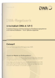
Arbeitsblatt DWA-A 149-5 (Entwurf)