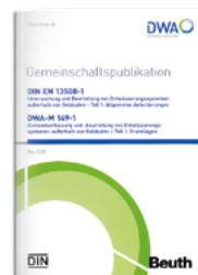
Gemeinschaftspublikation DIN EN 13508-1/ Merkblatt DWA-M 149-1

Print 120,00 €* E-Book 105,00 €* Kombi 151,50 €*