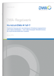
Merkblatt DWA-M 149-7

Teil 7: Beurteilung der Umweltrelevanz des baulichen/betrieblichen Zustands Januar 2016