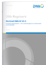
Merkblatt DWA-M 145-3

Print 85,00 €* E-Book 74,50 €* Kombi 107,00 €*