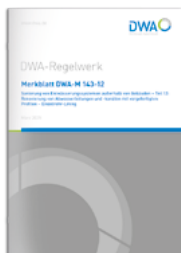
Merkblatt DWA-M 143-12

Print 120,00 €* E-Book 105,00 €* Kombi 151,50 €*