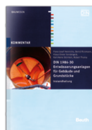
Kommentar zu DIN 1986-30

Print 59,50 €* E-Book 51,50 €* Kombi 75,00 €*