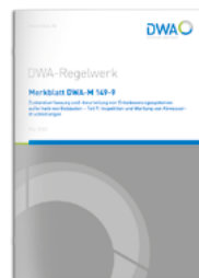
Merkblatt DWA-M 149-9

Teil 9: Inspektion und Wartung von Abwasserdruckleitungen Mai 2023