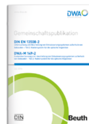
Gemeinschaftspublikation DIN EN 13508-2/ DWA-M 149-2

– Teil 2: Kodiersystem für die optische Inspektion/Zustandserfassung und -beurteilung von Entwässerungssystemen außerhalb von Gebäuden – Teil 2: Kodiersystem für die optische Inspektion Juli 2014, Stand: Ergänzte Fassung September 2023