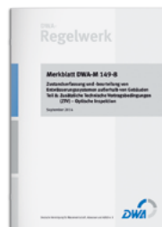
Merkblatt DWA-M 149-8

Teil 8: Zusätzliche Technische Vertragsbedingungen (ZTV) – Optische Inspektion September 2014 Merkblatt ohne digitale Fassung