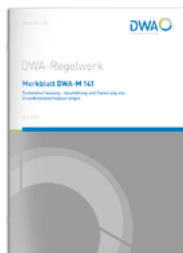
Merkblatt DWA-M 141

Zustandserfassung, -beurteilung und Sanierung von Grundstücksentwässerungen September 2025