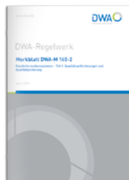
Merkblatt DWA-M 145-2

Print 118,50 €* E-Book 103,00 €* Kombi 149,00 €*