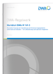
Merkblatt DWA-M 149-3

Zustandserfassung und -beurteilung von Entwässerungssystemen außerhalb von Gebäuden – Teil 3: Beurteilung nach optischer Inspektion Mai 2024